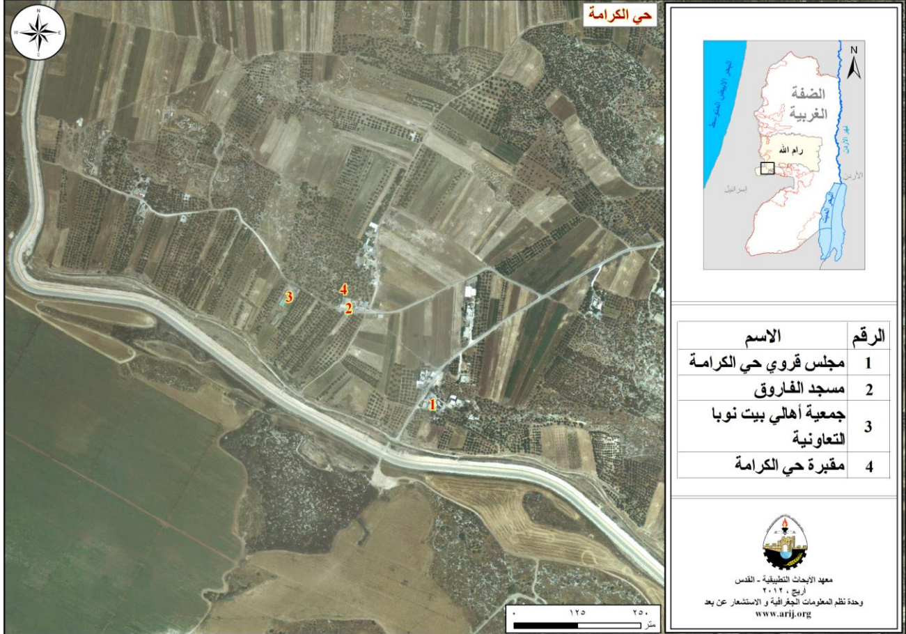
خريطة 2: المواقع الرئيسية في حي الكرامة

يوجد في حي الكرامة مسجد واحد، وهو: مسجد الفاروق، أما بالنسبة للأماكن والمناطق الأثرية في الحي فلا يوجد أية أثار (مجلس قروي حي الكرامة، 2013) (انظر الخريطة رقم 2).