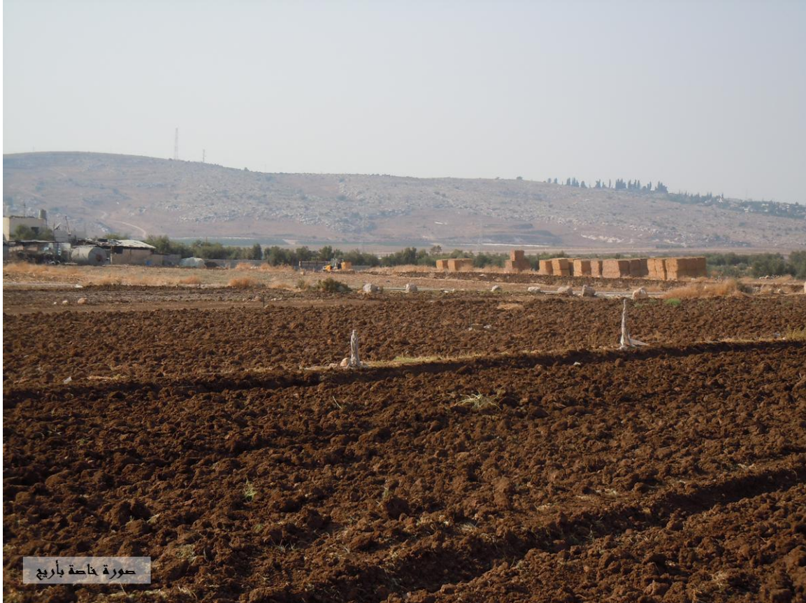
صورة 1: منظر من حي الكرامة

في عام 1973 م تم تأسيس (تجمع اهالي بيت نوبا) على جنوب أراضي بيت لقياء، وكان يمثله في السلطة الفلسطينية (لجنة مشاريع تجمع اهالي بيت نوبا)، وفي تاريخ 2012/7/19 صدر قرار من قبل وزير الحكم المحلي بتحويل لجان المشاريع إلى مجلس قروي، ومن ثم تحويل لجنة مشاريع تجمع أهالي بيت نوبا إلى اسم مجلس قروي بيت نوبا، حيث وصف سكان التجمع هذه الخطوة بالخطأ الكبير وذلك حسب تعبيرهم أن لا علاقة لقرية بيت نوبا المدمرة عام 1967 بهذا المكان سوى السكان الذين هجروا منها، تم تغيير اسم التجمع ليصبح (حي الكرامة) في 2013/4/16 وذلك بعد ملاحظة لبس في بعض الخرائط ما بين موقع تجمع اهالي بيت نوبا وموقع قرية بيت نوبا، وقد سمي حي الكرامة بهذا الاسم نسبة إلى قرية بيت نوبا القديمة المدمرة عام 1967 م، وهي من ضمن اربعة قرى تم تدميرها وهي يالو، عمواس ودير اللطرون (مجلس قروي حي الكرامة، 2013). ويعود تاريخ إنشاء الحي إلى عام 1973 م، ويعود أصل سكان الحي إلى قرى بيت نوبا، يالو وبيت لقياء (مجلس قروي حي الكرامة، 2013) (أنظر صورة رقم 1).